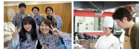
介護福祉士科春まつり