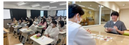
どろんこ会との連携授業

就労支援を行う喫茶ルポーズと連携し、介護福祉士科春まつりを開催。200名を超える地域の方にご来場いただき、販売や展示を実施。